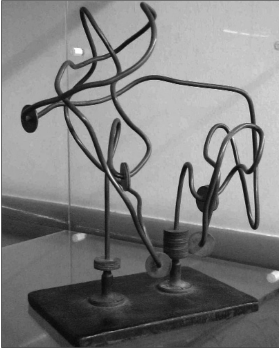
FIGURA 3. Ambidextròmetre de Rupp o Laberint de Rupp. (Fons de materials del Museu d'Història de la Facultat de Psicologia de la Universitat de Barcelona.)

ra que la conducta (traç dibuixat) deixava d'ésser controlada per la visió de la realitat externa. A partir d'aquesta pèrdua de seguiment visual, la manca de feedback debilitava el control de l'esquema motor que el subjecte s'havia construït amb l'ajut de la vista. Els treballs fets amb l'axiesteròmetre van permetre Mira constatar que els errors de la memòria muscular eren característics en cada persona i que podien servir per a saber-ne més de la seva personalitat. D'això van derivar més tard altres hipòtesis, com que les expressions motrius de la mà dominant indiquen les actituds i propòsits actuals, mentre que les de la mà no dominant informen dels propòsits i actituds instintives. Resumint, les tendències en el traç dibuixat per ambdues mans, amb i sense visió, servien d'indicador per a obtenir molta informació de l'examinat sense que intervinguessin altres factors que són font de biaix habitual en les mesures amb qüestionaris i altres mètodes convencionals.